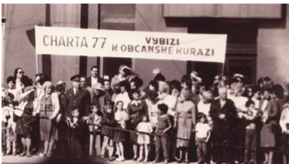
Výzva Charty 77.