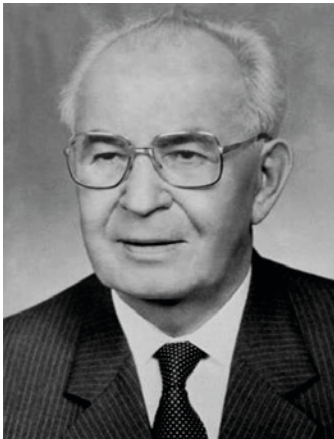
Gustáv Husák, 8. prezident Československa a jeden z hlavných politických predstaviteľov normalizácie.