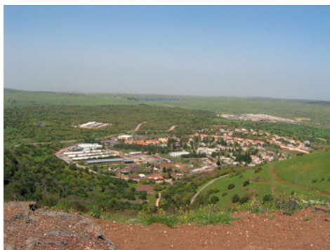
Kibuc Merom Golan.