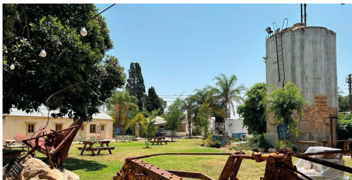
Kibuc Masaryk.