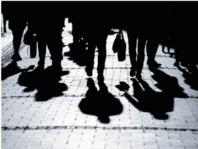
Ilustračná snímka.