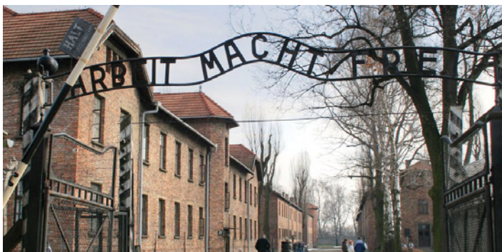
Ilustračná snímka.