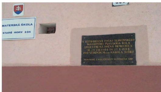
Ošetrovňa v Starých Horách, v ktorej sa liečil pán Strmeň.

Tvoja úloha: Napíš krátku reportáž, ktorú uverejniš v školskom časopise alebo na webe vašej školy, o pamätnom mieste súvisiacom s SNP. Uskutočni rozhovor s niekým, kto si na udalosti SNP pamätá. Napíš status na fb, instagram, ktorý upriami záujem mladých na udalosti SNP.