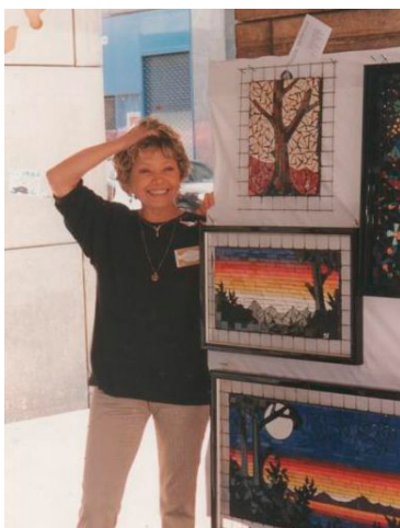
Magdina prvá výstava, Piazza Duomo, Miláno 2000.