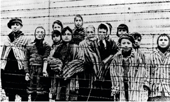
Deti, ktoré prežili koncentračný tábor (Auschwitz-Birkenau, 27. január 1945).