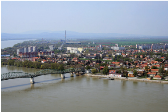
Pohľad z juhu na mesto Štúrovo.