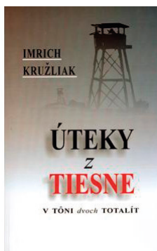
Ilustračná snímka.

3. Pán Kružíliak od mladosti publikoval vlastnú tvorbu, prispieval do študentských časopisov.