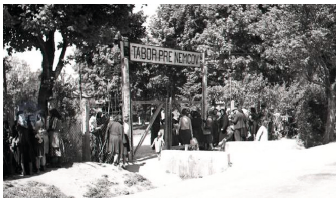
Tábor pre Nemcov v Petržalke v roku 1946.