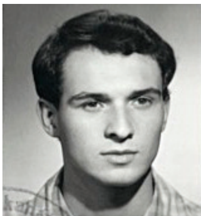
Jan Palach