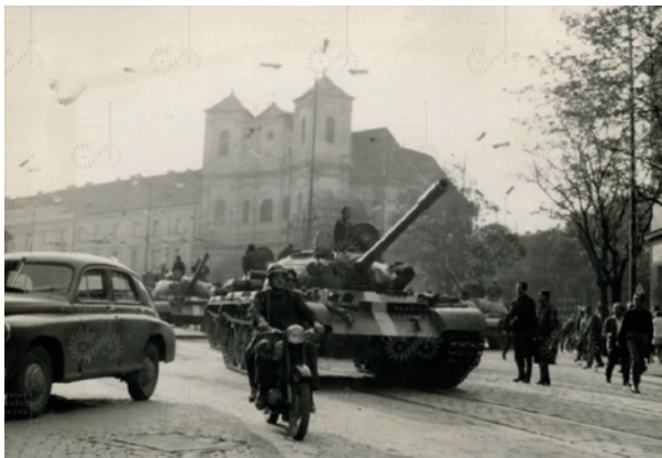
Okupačné tanky na Námestí SNP v Bratislave.