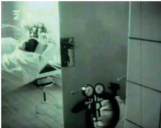
Jan Palach na oddelení popálenin.