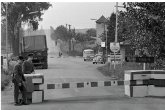
Hranica Československa s Rakúskom, rok 1968.

V čom bola solidárna s politickými emigrantmi?