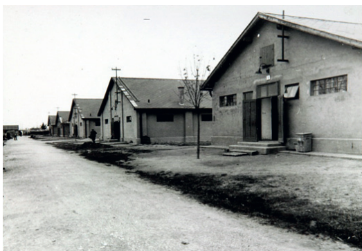
Pracovný a koncentračný tábor v Seredi.