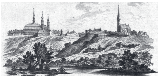
Hrad Čeklís.