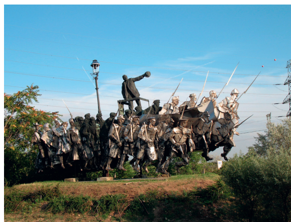
Socha niekdajšieho vodcu maďarských bolševikov Bélu Kuna v parku komunistických sôch na predmestí Budapešti.