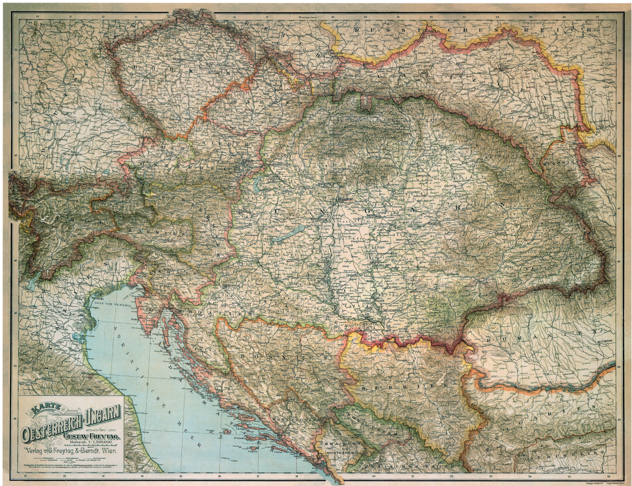
Mapa Rakúsko-Uhorska.