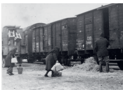
Maďari odsunutí do Čiech (z Gúty/Kolárova do Mladej Boleslavi) vo februári 1947.