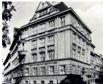
Obchodná akadémia v Českom Těšíne.