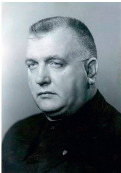
Jozef Tiso.

2. Objasni, v akom období bol v našej krajine tzv. ľudácky režim a čo znamenal pre život ľudí. Pomôž si spomínaním pamätníčky na obdobie po Mníchovskej dohode.