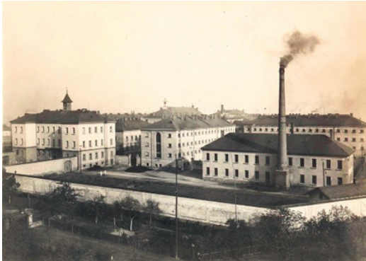
Krajská súdna väznica Praha Pankrác z obdobia Prvej republiky