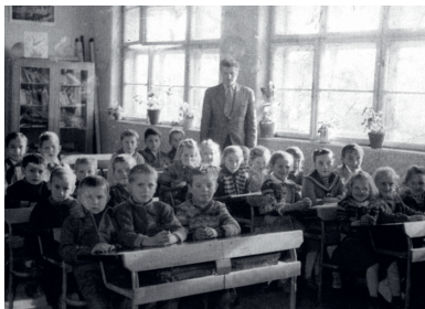
Škola v 1. ČSR, ilustračný obrázok.