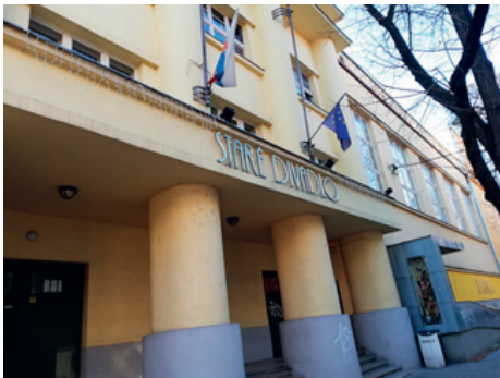
Vchod do budovy Starého divadla Karola Spišáka v Nitre dnes.