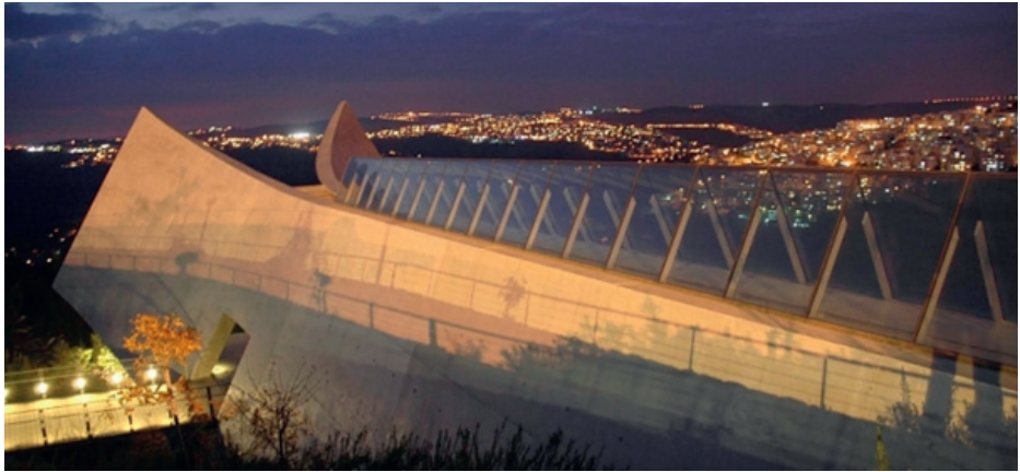
Yad Vashem.