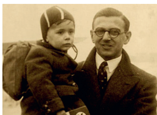
Fotografia Nicholasa Wintona s jedným zo zachránených detí.