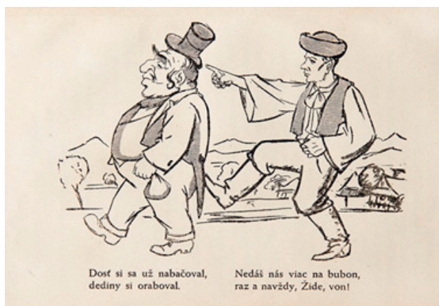
Protižidovská karikatúra. Zdroj: Webumenia.sk