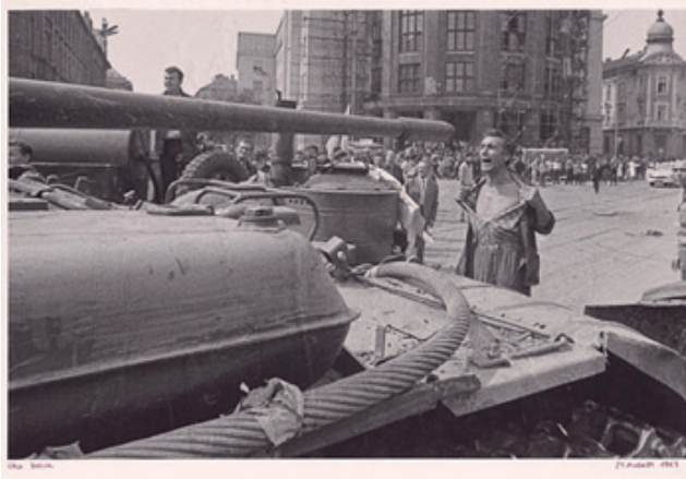
Ladislav Bielik: August 1968. Zdroj: Webumenia.sk