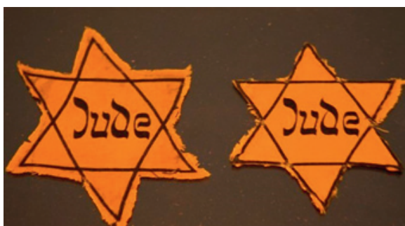
Židovská hviezda.