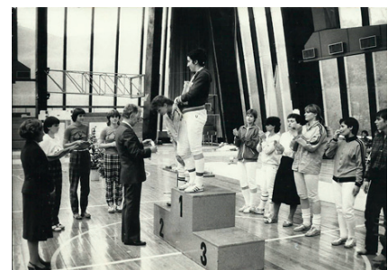
Majstrovstvá Československej republiky.