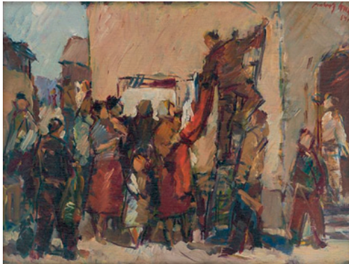
Július Balogh - Vyhlásenie SNP.