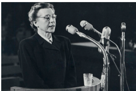
Milada Horáková.