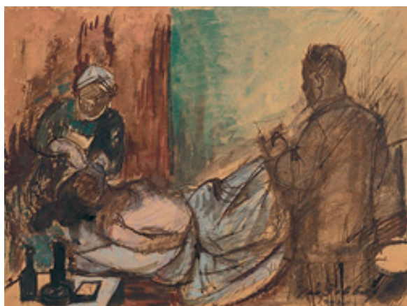
Ján Želibský: Chorá.