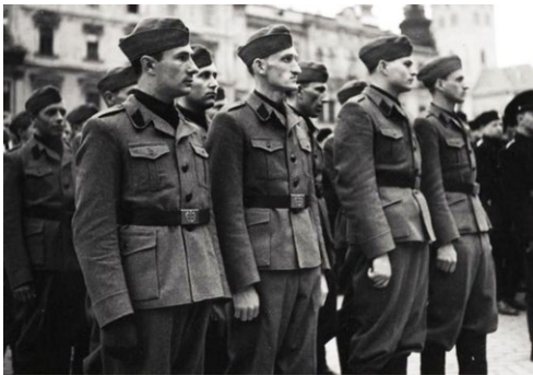
Vybrané jednotky HG nastúpené. Banskej Štiavnici

Vysvetli, čo bola Hlinkova garda. Koľko členov mala? Akej národnosti boli jej členovia? Za akým účelom bola vytvorená, kto bol iniciátorom jej vzniku? Čo bolo poslaním a úlohou Hlinkovej gardy v tej dobe?