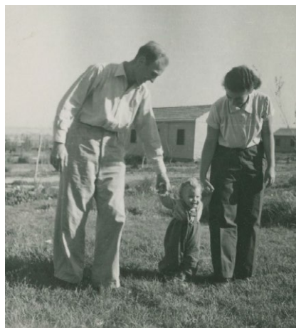
Rodina v kibucik Lehavot Chaviva, asi 1953