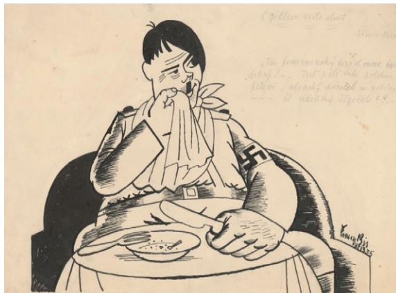
Autor: Štefan Bednár. S jedlom rastie chuť, 1935.

3. Uved' kontext tejto karikatúry s názvom „S jedlom rastie chuť“, ktorá vznikla v roku 1935 a jej autorom je Štefan Bednár. Ako sa táto karikatúra dotýkala Československa?