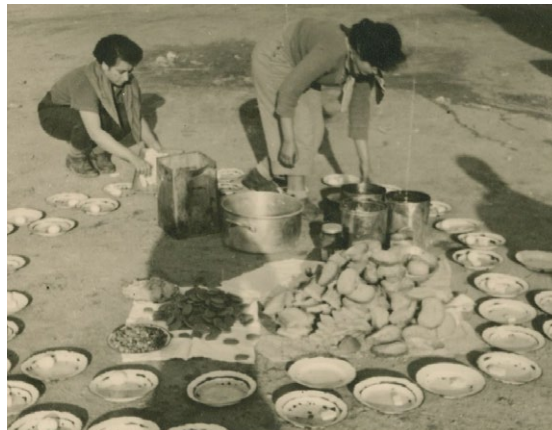
Príprava obeda, kibuc Lehavot Chaviva, asi 1953