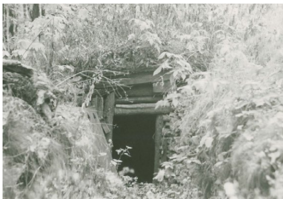
Pozostatok partizánskeho bunkru, kde sa Mikuláš ukrýval, asi 1946