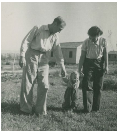
Rodina v kibuci Lehavot Chaviva, asi 1953