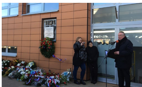
Fotografia zo spomienkovej udalosti v Poprade pri príležitosti 75. výročia prvého transportu zo Slovenska.