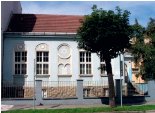
Ortodoxná synagóga v Žiline.