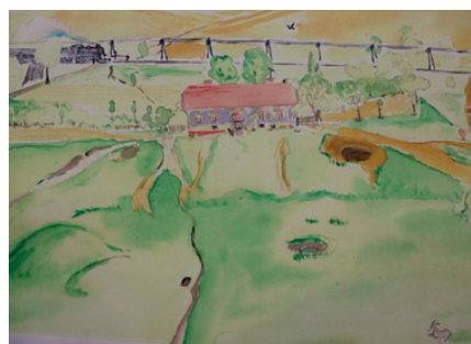
Malba Štefanovho rodného domu.