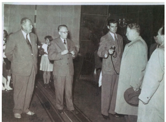
Novinár v akcii.