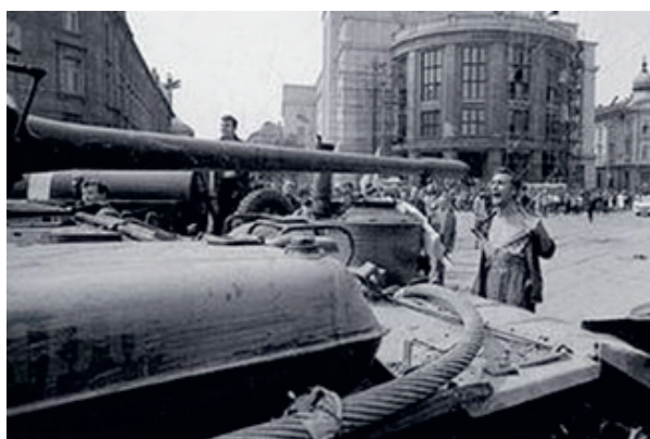
Sovietske tanky v Bratislave, autor fotografie: Ladislav Bielik. Zdroj: Sme.sk