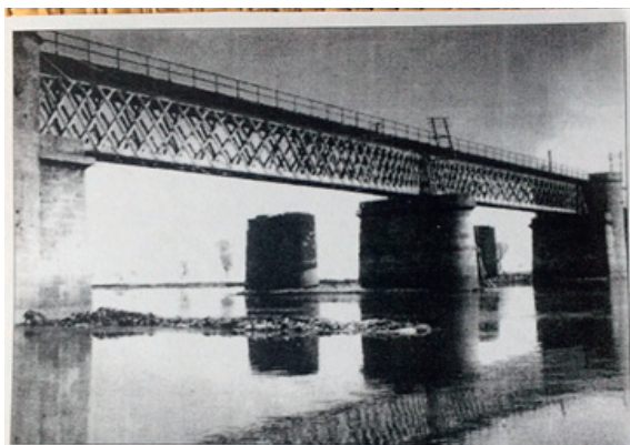
Pohľad na most