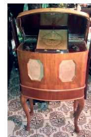
Rádio – cca 30.roky 20.storočia.