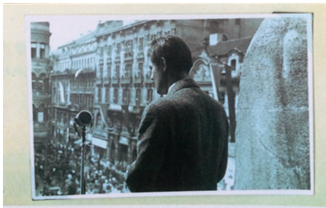
1.máj, živé vysielanie na Václavskom námestí, Praha.