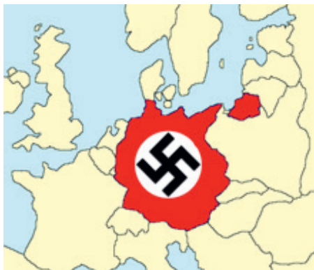
Rozloha Nemecka pred obsadením Poľska v roku 1939.