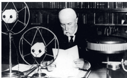
Prvý československý prezident T. G. Masaryk prehovoril v roku 1932 k americkým poslucháčom.