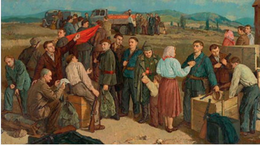
Nástup do SNP.