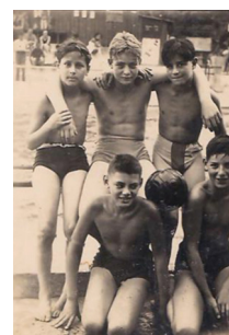
Plavecký klub Bar Kohba, Bratislava