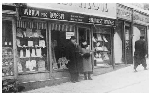
obchod rodiny Salamonovcov pod Michalskou bránou v Bratislave

2. Popíšte detstvo, štúdium, záujmy a život rodiny pána Šmuela pred 2. svetovou vojnou. Kto mu vybral budúcu profesiu a z akého dôvodu?