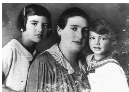
Šmuel s mamou a sestrou