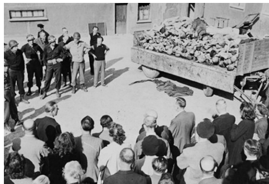
Buchenwald po oslobodení