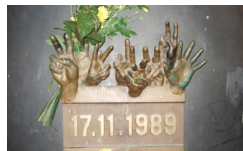
Pamätník Nežnej revolúcie.