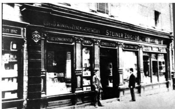
Pôvodný antikvariát Steiner v roku 1847